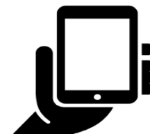
Смартфон или планшет с доступом в сеть Интернет