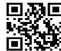
Приложение для считывания QR-кода